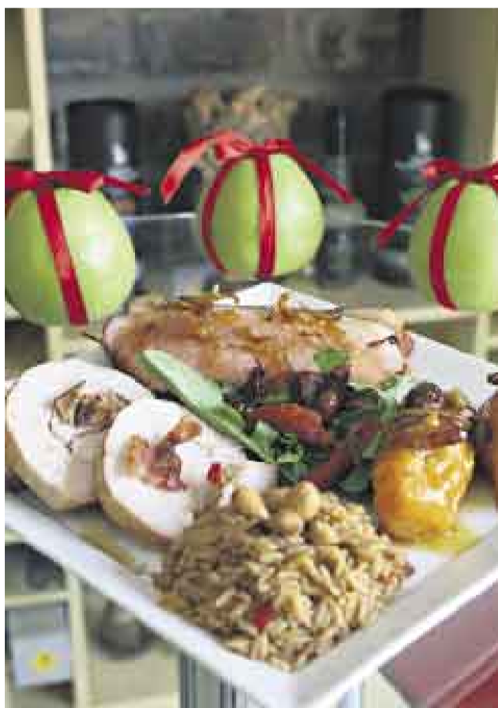
La importancia de la cena de Navidad estriba en los ingredientes especiales utilizados para agasajar a la familia.